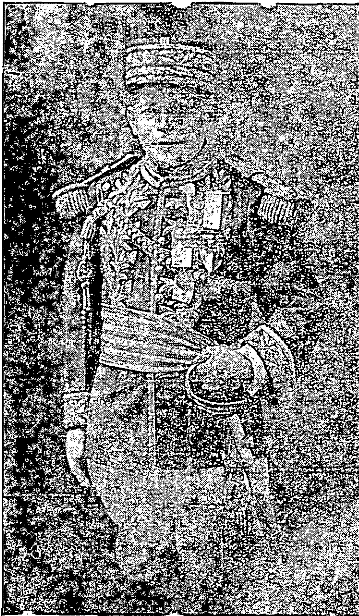
GENERAL ESTEBAN HUERTAS

El Guante saluda al General Esteban Huertas en este día simbólico en el que su actitud fué factor decisivo para la formación de la Patria itmeña. Los panameños agradecerán siempre su gesto heroico.