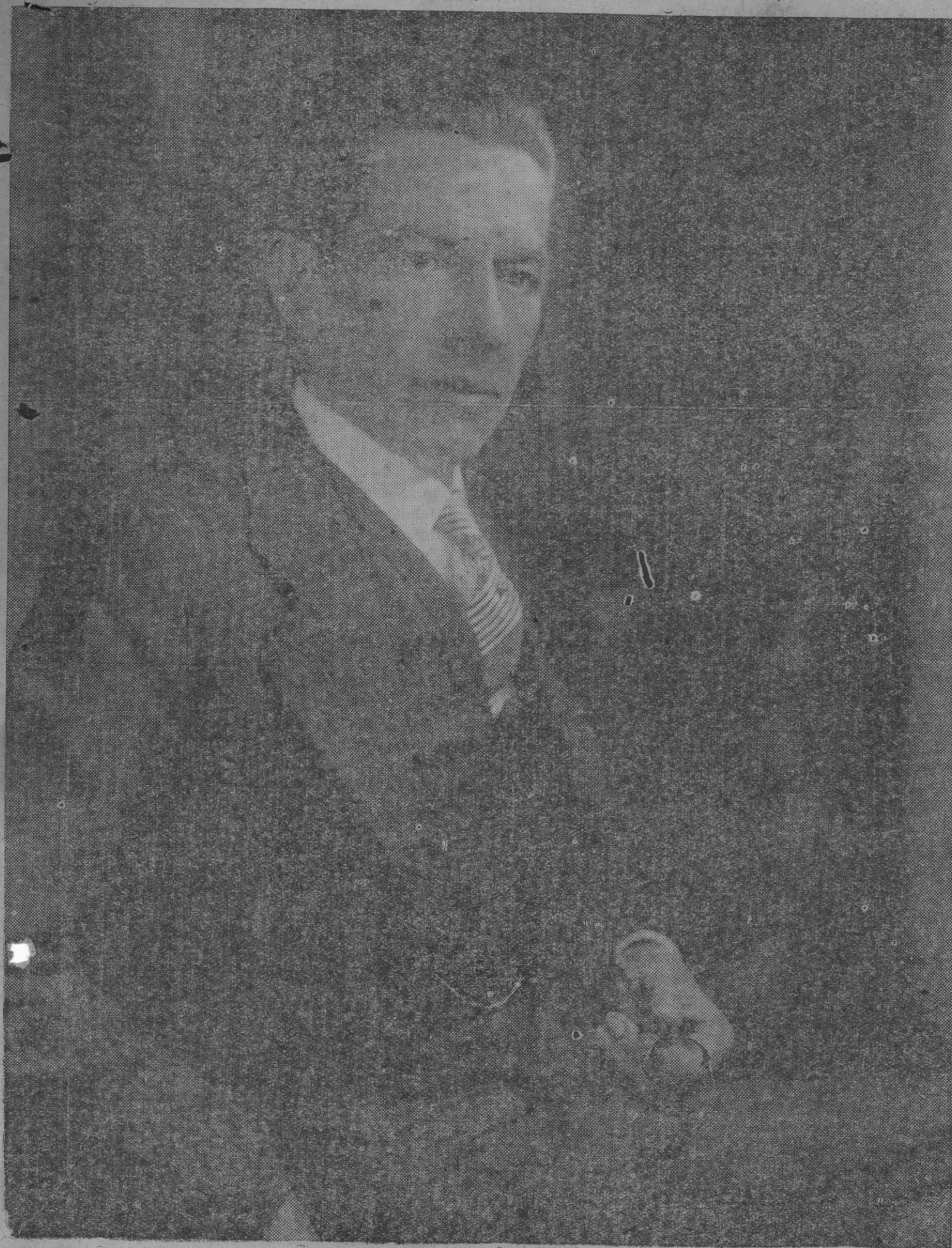
DR. HARMODIO ARIAS Presidente de la República